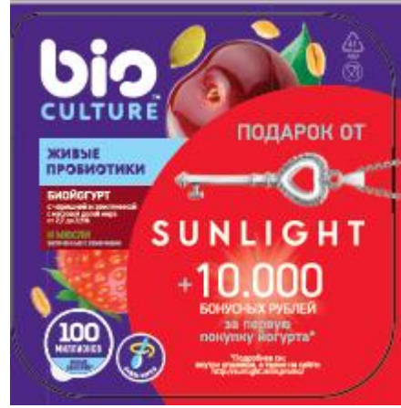
Дизайн акционного тиража: внутренняя упаковка (платинка) (универсальная для всех вкусов, различается уникальным 9-мизначным промокодом):